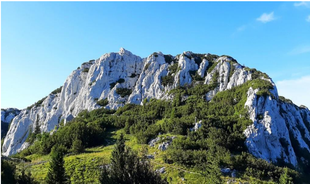
Slika 2 Hajdučki i Rožanski kukovi