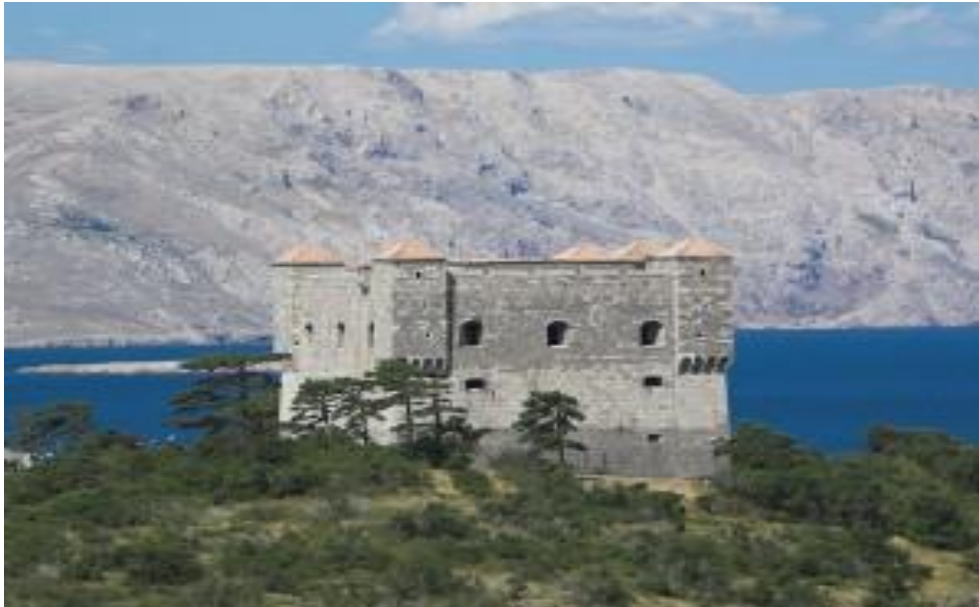
Slika 3. Tvrđava Nehaj