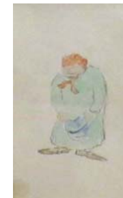
Ladislav Vukelić (Lado)

Stoga s radošću pozivamo sve prijatelje i ljubitelje muzejske djelatnosti na kulturno događanje u GMS koje čini otvaranje i predstavljane zanimljive izložbe te razgledavanje muzejskih zbirki-izložaba (uz gratis ulaznice i stručno vođenje) nakon čega slijedi druženje uz čaj, kavu, sokove i domaće frite od 18,00 sati do 01,00 sat poslije ponoći.