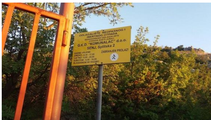
Slika 1: Ulaz na odlagalište neopasnog otpada „Sveti Juraj“

Reciklažno dvorište Senj upisano je u Očevidnik reciklažnih dvorišta (KLASA: 351-02/18-138/21, URBROJ: 517-03-2-2-18-2) Ministarstva zaštite okoliša i energetike, Uprave za procjenu utjecaja na okoliš i održivo gospodarenje otpadom dana 31. listopada 2018. godine pod brojem upisa: GRADSKO KOMUNALNO DRUŠTVO SENJ d.o.o. - REC - 114.