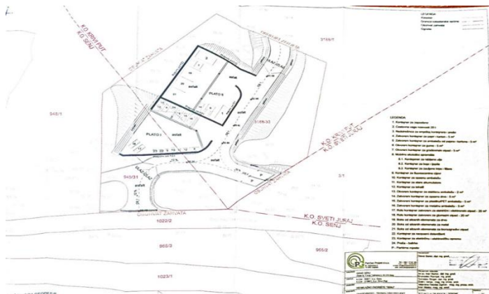
Slika 2: Lokacija reciklažnog dvorišta na području Grada Senja