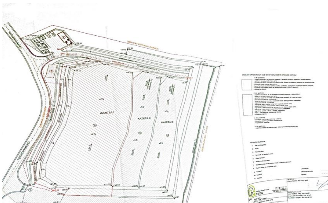
Slika 4: Izvadak iz projekta Odlagalište neopasnog otpada "Sveti Juraj"