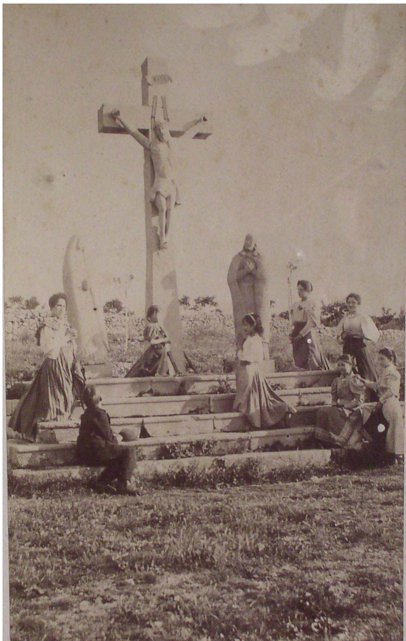
Senjska kalvarija, 19./20. st.