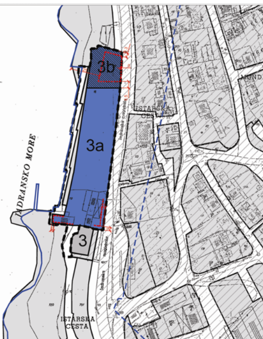
Kartografski prikaz 4 Načini i uvjeti gradnje [umanjen iz mjerila 1:1.000]