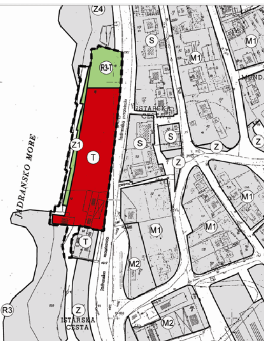
Kartografski prikaz 1 Korištenje i namjena površina [umanjen iz mjerila 1:1.000]